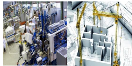
Eco-Matériaux, Industrie et Génie Civil