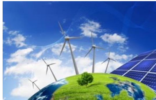
Énergie et Environnement