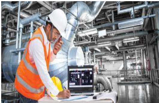
Industrie et Services

Ce choix conditionnera à la fois le contenu du cycle préparatoire (2 ème partie) et le parcours de formation en cycle Ingénieur.