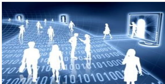
Sciences et technologies du numérique